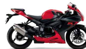
Pearl Mira Red / Metallic Mat Black No.2 (ARB)