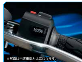
※写真は当該車両とは異なります。 Suzuki Drive Mode Selector (S-DMS)