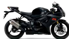
Metallic Mat Black No.2 / Glass Sparkle Black (KGL)