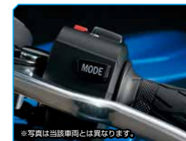
※写真は当該車両とは異なります。 Suzuki Drive Mode Selector (S-DMS)