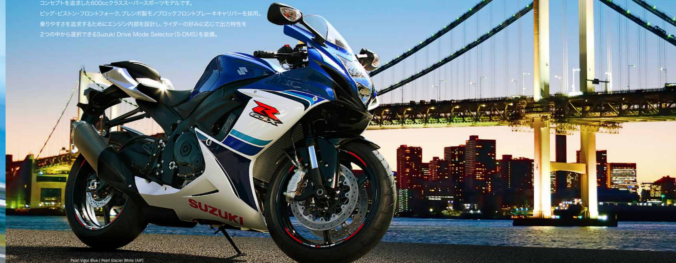
Pearl Vigor Blue / Pearl Glacier White (AJP) (30周年記念カラー)

GSX-Rシリーズに共通する“The Top Performer”というコンセプトを追求した600ccクラススーパースポーツモデルです。ビッグ・ピストン・フロントフォーク、ブレンボ製モノブロックフロントブレーキキャリパーを採用。乗りやすさを追求するためにエンジン内部を設計し、ライダーの好みに応じて出力特性を2つの中から選択できるSuzuki Drive Mode Selector (S-DMS)を装備。