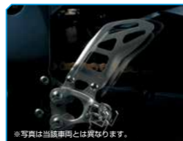
※写真は当該車両とは異なります。 3-way adjustable footpeg