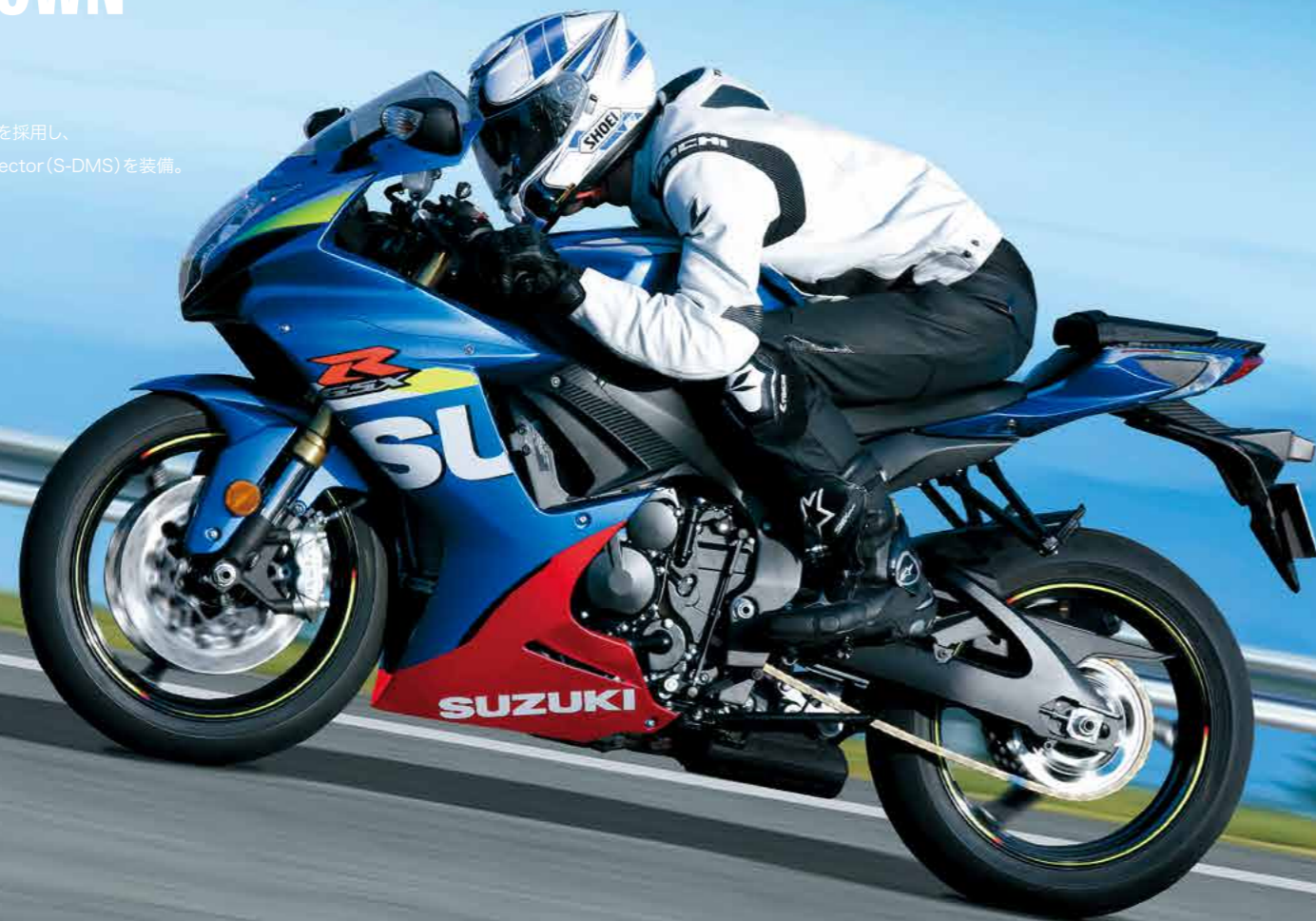
Metallic Triton Blue (YSF)

1985年の発売当初より、スポーツライディングを楽しめるスーパースポーツとして、25年以上にわたって常に進化を続けるマシン。ビッグ・ピストン・フロントフォーク、ブレンボ製モノブロックフロントブレーキキャリパーを採用し、ライダーの好みに応じて出力特性を2つの中から選択できるSuzuki Drive Mode Selector (S-DMS)を装備。750ccの排気量とコンパクトな車体により、高いコントロール性を実現しています。