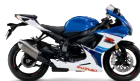
Pearl Vigor Blue / Pearl Glacier White (AJP) (30周年記念カラー)