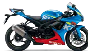
Metallic Triton Blue (YSF)