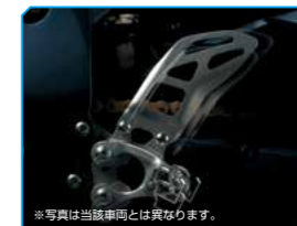
※写真は当該車両とは異なります。 3-way adjustable footpeg