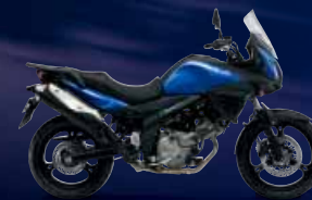
Pearl Vigor Blue (YKY)