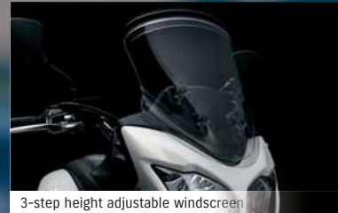
3-step height adjustable windscreen