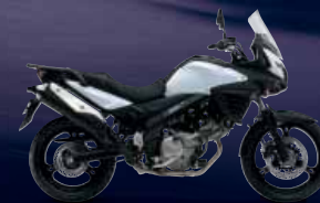
Pearl Glacier White (YWW)