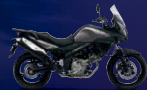
Metallic Thunder Gray (YLF)