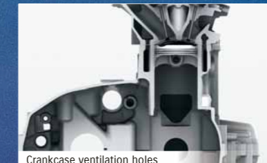
Crankcase ventilation holes