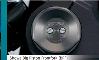
Showa Big Piston Frontfork (BPF)