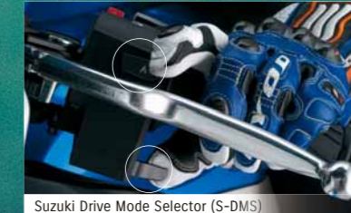
Suzuki Drive Mode Selector (S-DMS)

スタイリングデザインもGSX-Rとしてのアイデンティティを継承しながら、さらに魅力的に進化しています。