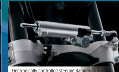
Electronically controlled steering damper