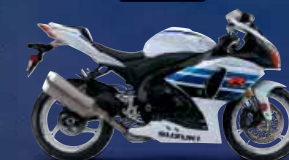
Pearl Glacier White (YWW) Photo : 1 Million Commemorative Edition

※写真はプロライダーによるサーキットコース走行時のものです。公道では交通法規を遵守し、安全運転に心がけましょう。