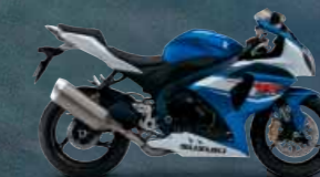
Metallic Triton Blue / Glass Splash White (GLR)