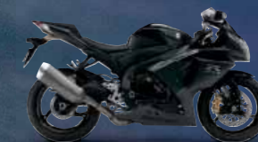
Metallic Mat Black No.2 / Glass Sparkle Black (KGL)