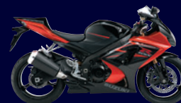
Candy Max Orange / Solid Black (ECE)