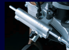
Electronically controlled steering damper