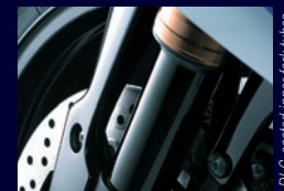
DLC-coated inner fork tubes