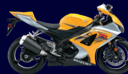
Marble Daytona Yellow / Metallic Mystic Silver (EDS)