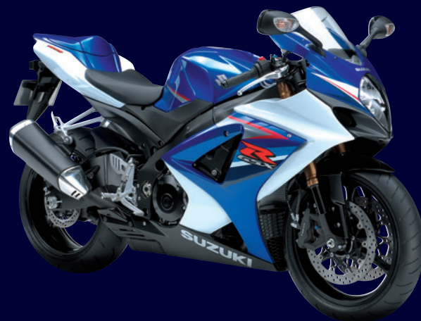
Pearl Vigor Blue / Grass Splash White (CWH)