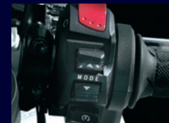
Three performance settings