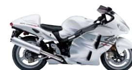
Limited Pearl Glass White / Metallic Sonic Silver (CZZ)