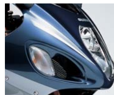
Dual headlights, SRAD intakes