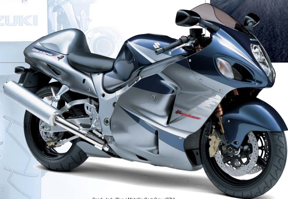
Candy Indy Blue / Metallic Oort Gray (CZV)