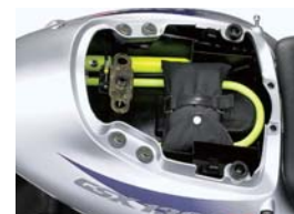
Storage compartment (U-lock is not attached)