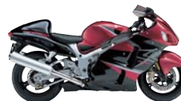
Candy Sonoma Red / Pearl Nebular Black (CZW)