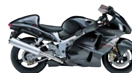
Metallic Phantom Gray / Pearl Nebular Black (CZY)